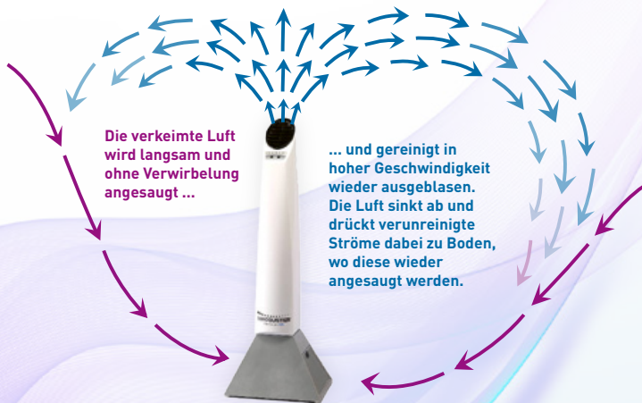
Schematische Darstellung des Downflow-Prinzips

Bei der Bestrahlung von Corona-Viren erzeugt die spezielle Bauform der VIROBUSTER®-Geräte außerdem eine gezielte Zirkulation nach dem Downflow-Prinzip . Dies verbessert die Luftqualität und minimiert Infektionsrisiken zusätzlich: